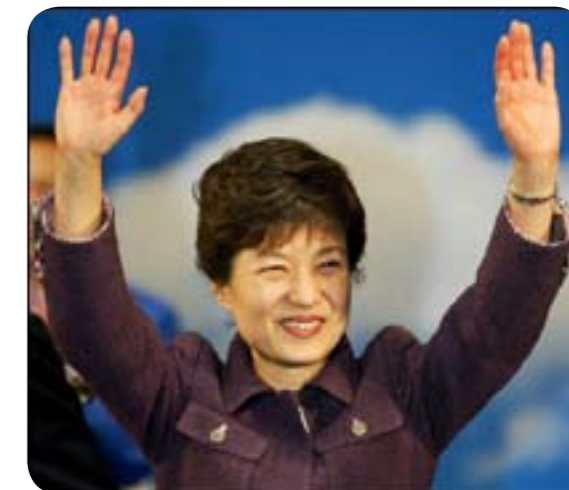
Park Geun-hye, favorite à la présidentielle 2012

La Corée du sud est une démocratie présidentielle avec une importance de plus en plus forte du parlement. Bien que le pays soit démocratique, de nombreuses affaires ont entachées la caste politique obligeant même en 2004 la destitution du président. C'est donc dans un contexte de difficulté démocratique et de méfiance envers les partis politiques qu'aura lieu cette élection.