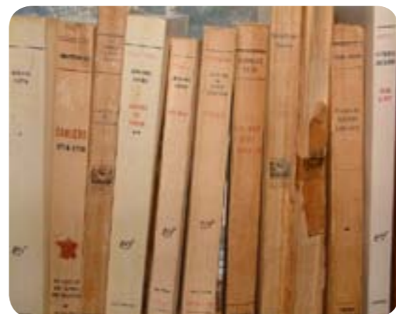
Ach, rien de tel pour réchauffer ses soirées d'hiver, ja.

Comment rester concentré en lisant Le Château ou Ulysse sans avoir la plus petite, la plus minuscule, la plus infinitésimale tentation de parcourir ses mails, son mur Facebook, son compte Twitter, son blog bd préféré et son site d'info favori ? Hein, je vous le demande, et plutôt deux fois qu'une : comment peut-on être assez bête pour croire que la lecture ne réclame pas patience, silence, solitude et concentration ?