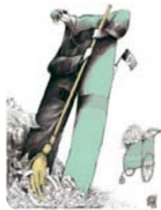
Le Mexique aux urnes Sur les bulletins: mains propres, plus de sécurité, les pauvres d'abord, emploi...

Il y a six ans, le président actuel avait été élu sur le fil du rasoir. Seul 0,6 % des suffrages exprimés séparaient Calderon de Manuel Lopez Obrador, représentant le PRD, parti de gauche. Le candidat malheureux a poussé l'affaire devant la justice persuadé de la non conformité de l'élection de son rival, mais avait été rebouté. Calderon a donc fini par prendre possession du pouvoir avec quelques mois de retard, en décembre 2006. Celui-ci ne peut pas se représenter en 2012 au vu de la constitution de 1917 qui impose un mandat non renouvelable. Mais pour le remplacer, les prétendants sont nombreux et appartiennent pour les plus importants aux trois grands partis politiques mexicains : le Parti Action Nationale (PAN, droite au pouvoir), Parti Révolutionnaire Institutionnel (PRI, opposition de centre-gauche majoritaire au parlement) et Parti de la Révolution Démocratique (PRD, opposition de gauche). En effet le mode de scrutin au suffrage universel majoritaire à un tour ne permet pas aux petits partis mexicains de se faire réellement entendre. Dès le premier tour, le candidat détenant le plus de voix se voit directement élu. Pas de jeu d'alliance possibles entre les deux tours comme chez nous, le vote utile est donc de rigueur.