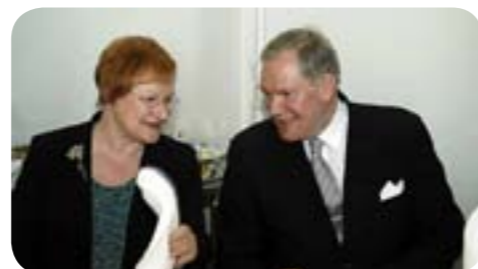
L'actuelle présidente et le candidat du SDP

La Finlande est une république démocratique avec une certaine tendance pour le parlementarisme. Leur président est élu tous les six ans par le biais du suffrage universel direct, il a toutefois un pouvoir assez faible ce qui évite les dérives présidentielistes que l'on connaît dans certains pays. L'Eduskunta, le parlement finlandais, est composé de 200 députés et à un pouvoir plutôt fort. En effet l'eduskunta entérine le gouvernement et peut le censurer. Il peut aussi voter les lois et modifier la constitution.